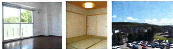
内装リフォーム済!